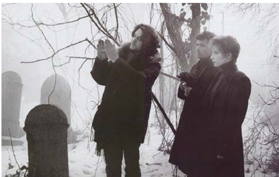
Mylene Farmer, filmare REGRETE.

4. Farmer, Mylene. L'auto interviews . În: „OK”, Paris, 20 februarie 1989.