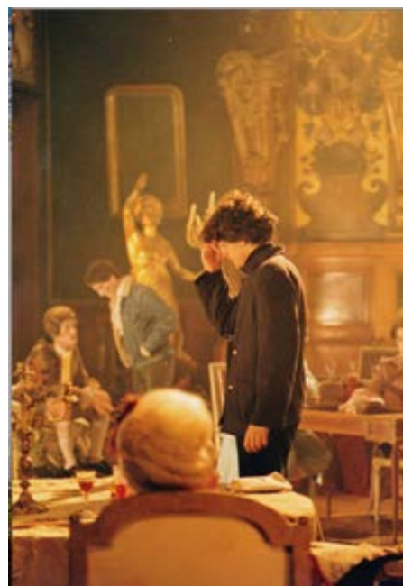
Mylene Farmer, Platoul de filmare LIBERTINE.